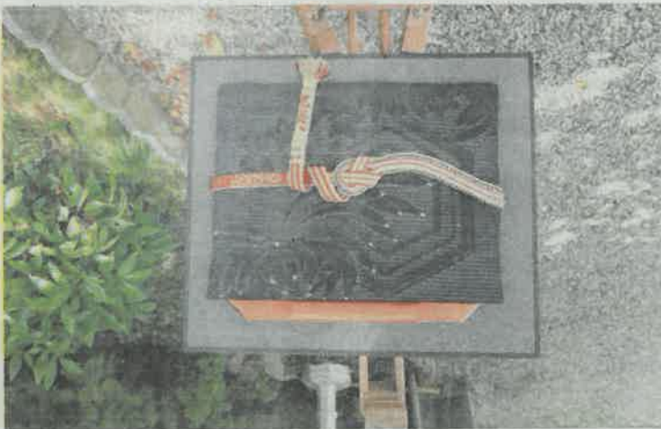
Claire Cassan pratique l'art traditionnel du tissage japonais, appelé Kumihimo.